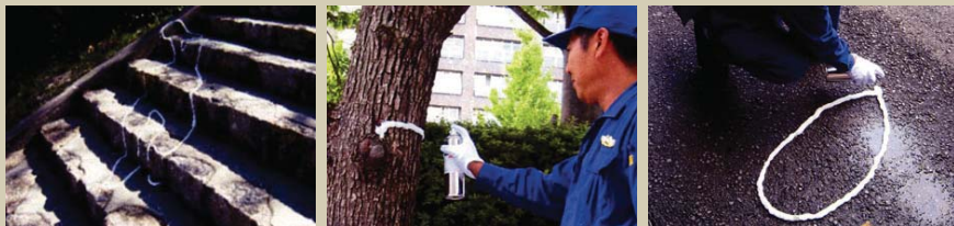
階段などの段差のある斜面でも 木など、凹凸の立体物にも可能 濡れた地面のような天候でも可能

犯罪現場で、死体などが、斜面・凹凸の場所・天候など悪条件の場合でも容易に接着できます。